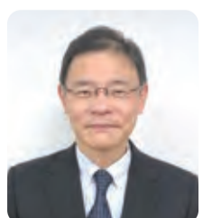
監修：山本 松男先生 昭和大学歯科病院 教授、歯周病科診療科長 日本歯周病学会 歯周病専門医・指導医

ただ適応症を見極めるための事前検査が重要です。治療費もリグロスとGTR法は保険適用ですが、保険適用外の材料があったり、組み合わせると保険適用でなくなったりするケースもありますので、事前に担当医とよく相談する必要があります。