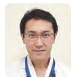
監修：木村 信康先生 湘南藤沢徳洲会病院 痛みセンター(ペインクリニック)主任部長 ペインクリニック専門医

学会の専門医認定試験に合格することで取得できます。 ペインクリニック専門医が在籍しているかどうかは、日本ペインクリニック学会のホームページで公開しています。近くの医療機関を選択する上での目安にしてください。